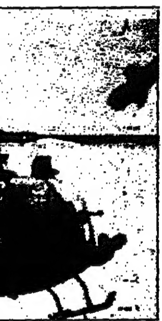
طائرة هيوكوبر فرنسية مزودة للجنايات

وقد قررت الولايات المتحدة ارسال مئة مائة عجلة يبلغ خمسين طون دولاراً لدعم اجراءات الحكومة المذكورة سابقاً والمساعدة في تنفيذها وقد هاجم اليمينيون هذه «الاصلاحات» ووصفوها بانها اصلاحات شيوعية بنسبها انتقدتها اليساريون بالقول بانها اجراءات «لتنجيب وجه الحكومة البشع»